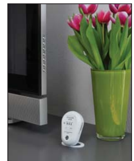
...oder zum Aufstellen