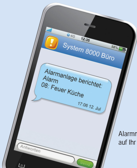
Alarmanlage berichtet: Alarm 08: Feuer Küche 17.06.12. Jul